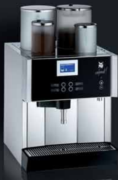
1 Kaffeemehlbehälter, abschließbar 1 aromaversiegelter Vorratsbehälter 1 kleiner Kaffeemehlbehälter, abschließbar z. B. für koffeinfreien Kaffee, mit Granulatreinigung Leistung 6 kW