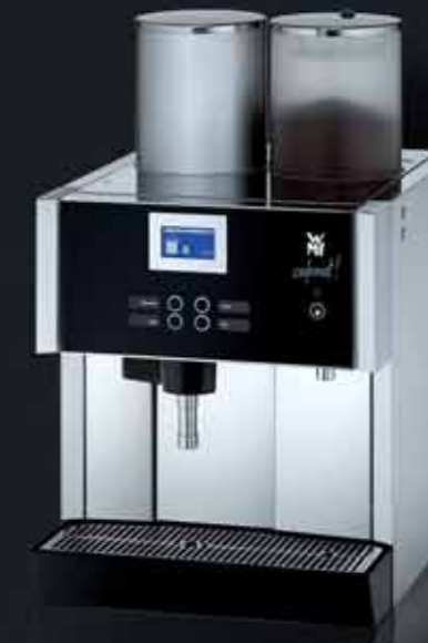
1 Kaffeemehlbehälter, abschließbar 1 aromaversiegelter Vorratsbehälter Mengenbrüharm rechts Leistung 6 kW