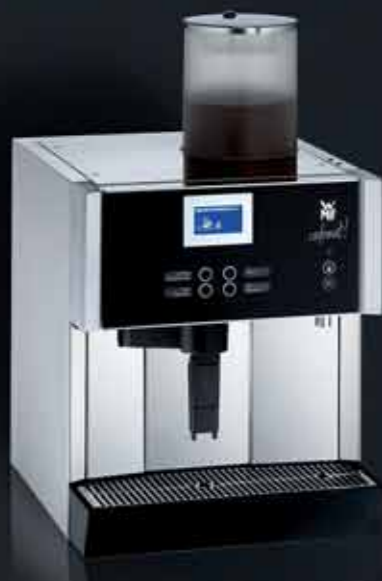
1 Kaffeemehlbehälter, abschließbar Klappauslauf Leistung 3 oder 6 kW