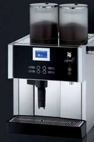
2 Kaffeemehlbehälter für 2 Sorten, abschließbar Mengenbrüharm rechts Klappauslauf Leistung 3 oder 6 kW